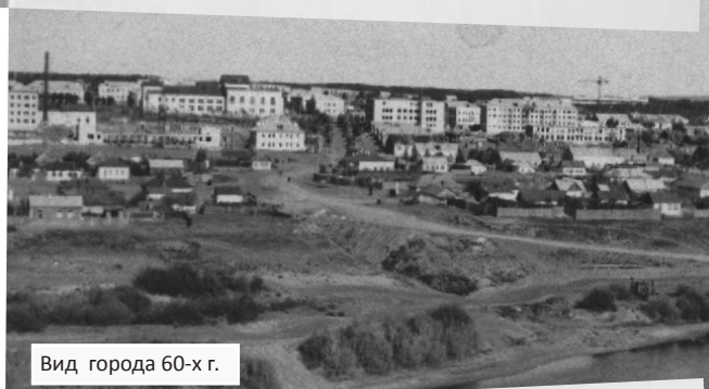
Вид города 60-х г.

● Указом Президиума Верховного Совета РСФСР от 10 ноября 1961 года Сталинградская область переименована в Волгоградскую область.