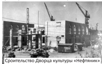
Строительство Дворца культуры «Нефтяник»