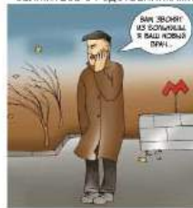
Сам звонит из сотового и вы слышите ДРЖ.

БУДЬТЕ БДИТЕЛЬНЫ, СПОКОЙНЫ И НЕ БОЙТЕСЬ ЗАЛУЧИВАНИЙ И УГРОЗ ОБЯЗАТЕЛЬНО СВЯЖИТЕСЬ С РОДСТВЕННИКАМИ!